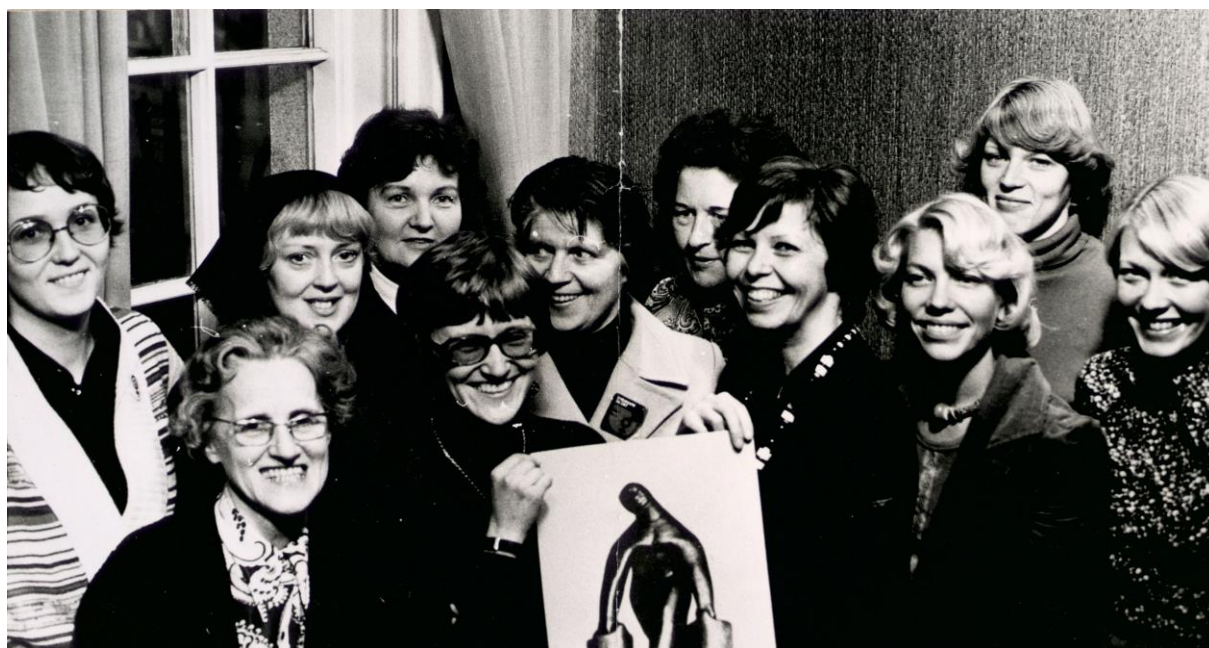
Framkvæmdanefnd um kvennafri 1975