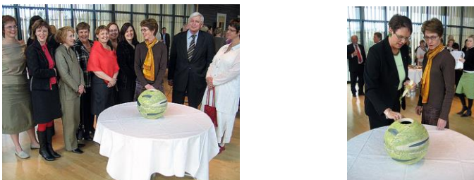
Frá afhendingu gjafar kvennasamtaka til Alþingis 27. júní 2005.