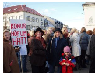
Manngrúi í miðbæ Reykjavíkur 24. október 2005.

Aðgerðin hófst á því að konur söfnuðust saman á Skólavörðuholti og kl. 15:00 var gengið sem leið lá niður Skólavörðustíg og Bankastræti og eftir Austurstræti á Ingólfstorg þar sem fundur hófst kl. 16:00. Gangan var farin undir slagorðinu „Konur höfum hátt“ og mikið bar á hvatningarhrópum og söng í göngunni. Er gangan hélt af stað var mannþröngin svo mikil í bænum að hún varð að brjóta sér leið niður á Ingólfstorg. Þar komust miklu færri fyrir en vildu.