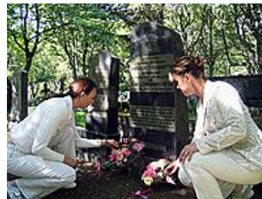
Frá athöfninni í Hólavallakirkjugarði 18. júní 2005.